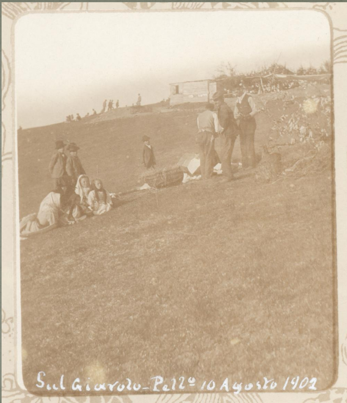
Sul Giarolo - Pell e 10 Agosto 1902