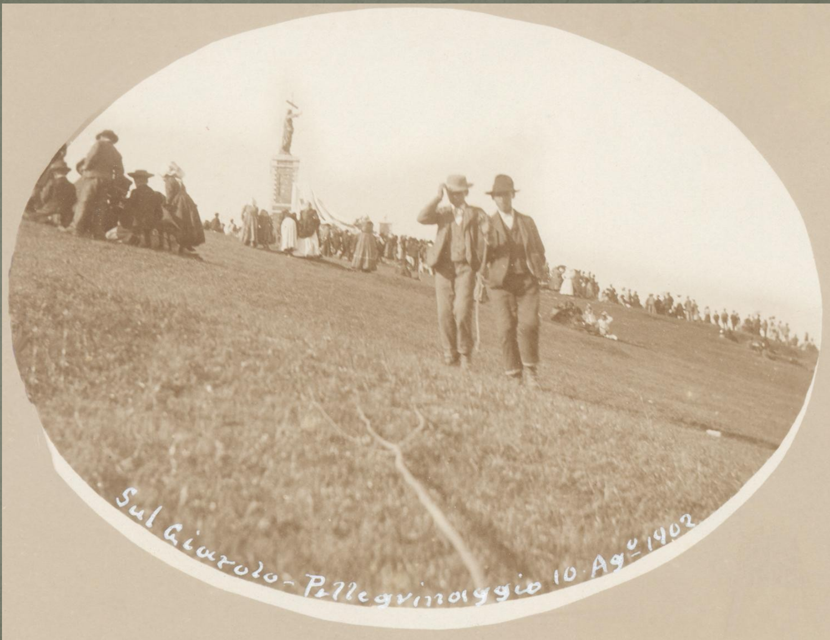
Sul Giareolo - Pellegrinaggio 10. Ago 1902