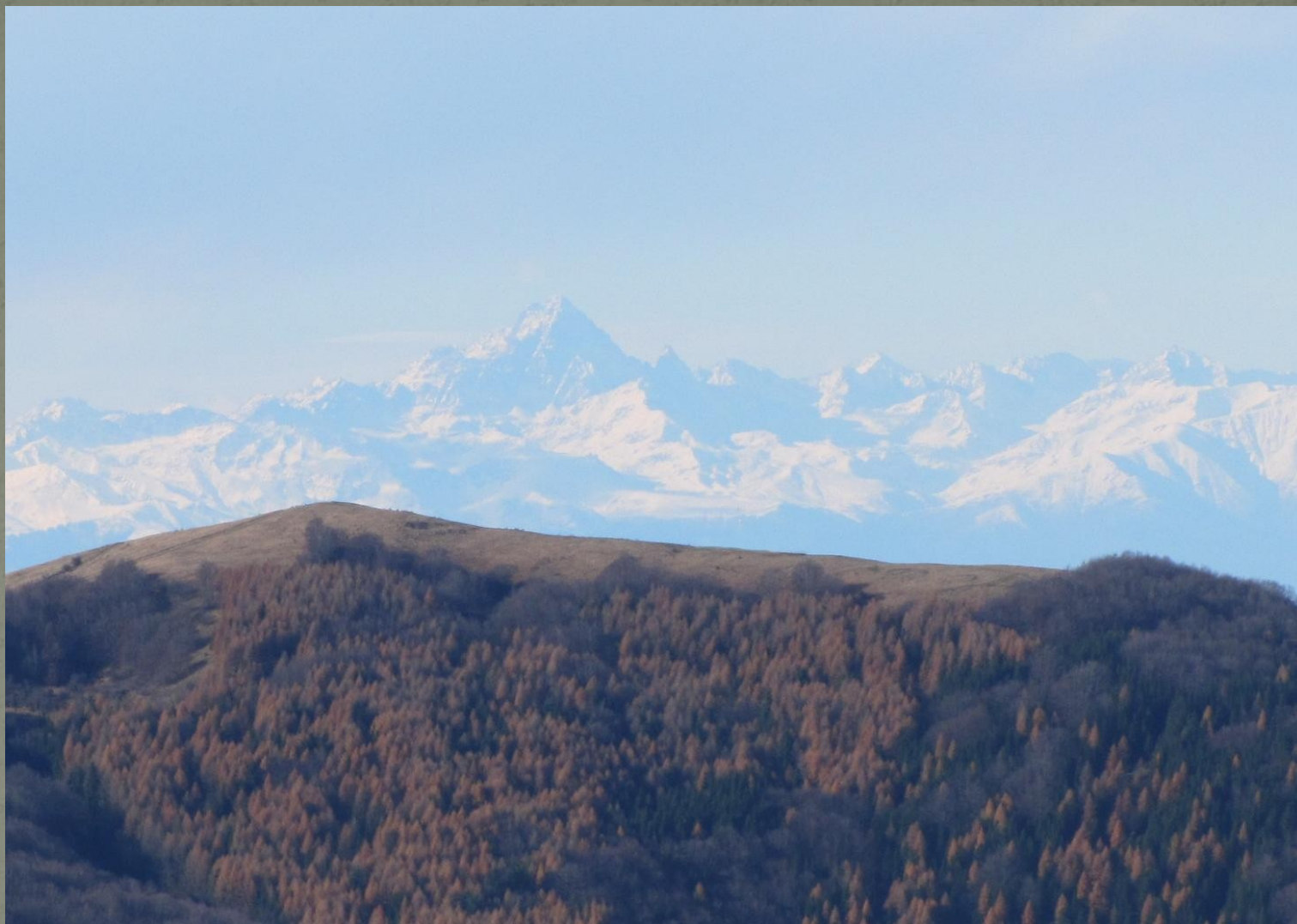
SI ERA NEL 1850 - IL GIAROLO - visto dal Boglelio