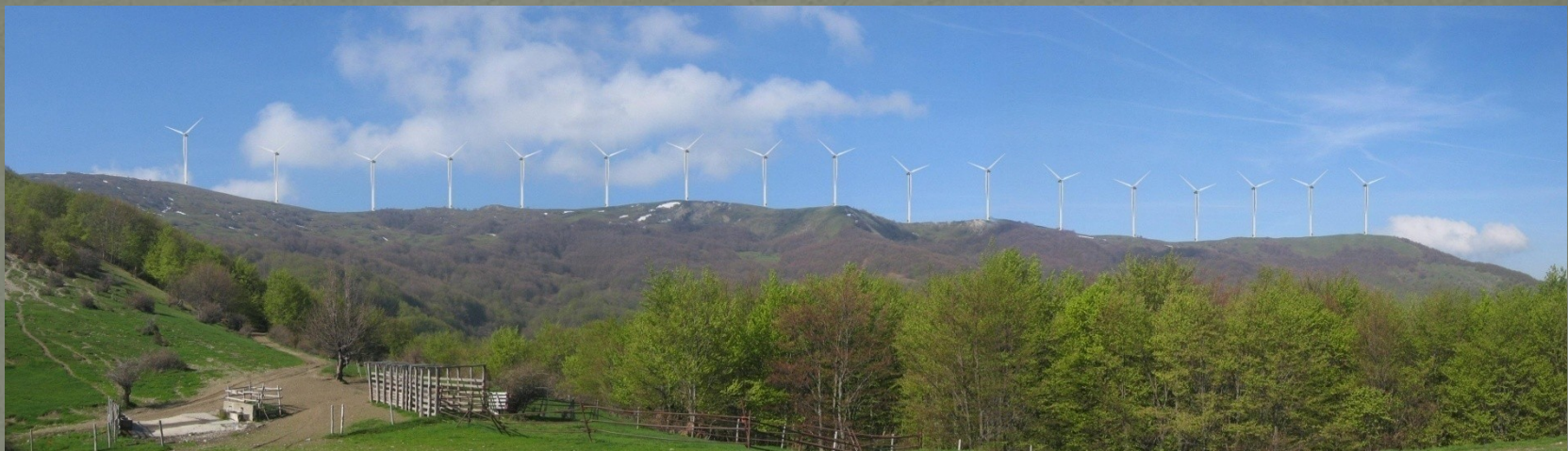
VEDUTA DALLA FONTANA DI COSTA PAMPREGNONE